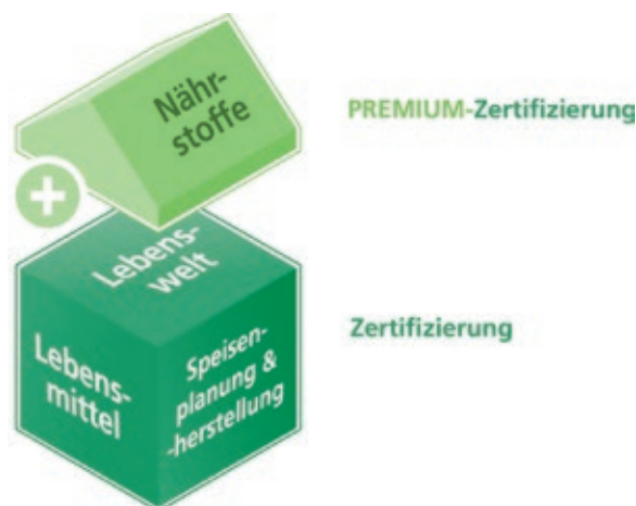
Abbildung 2: Qualitätsbereiche der Zertifizierung

Nach bestandenem Audit wird der Tageseinrichtung für Kinder ein Zertifikat einschließlich Logo-Schild verliehen, das die FIT KID-PREMIUM-Zertifizierung ausweist. Die folgende Abbildung 2 stellt die Qualitätsbereiche der Zertifizierung dar.