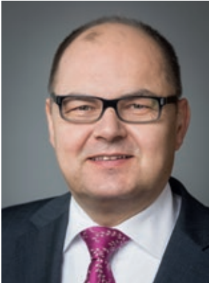
Christian Schmidt