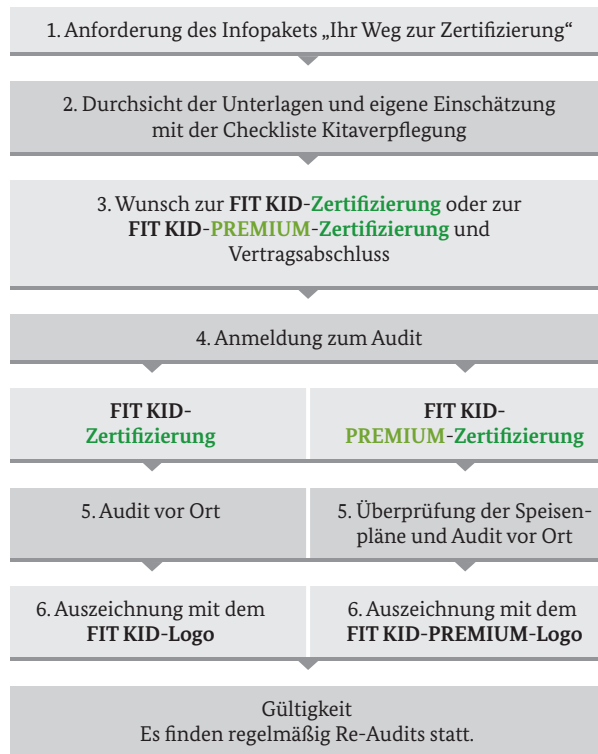
Abbildung 3: Ablauf der Zertifizierung 60

Zur Zertifizierung stehen unterschiedliche Informationsmaterialien zur Verfügung. Tabelle 9 zeigt deren Inhalte und Bezugsquellen.