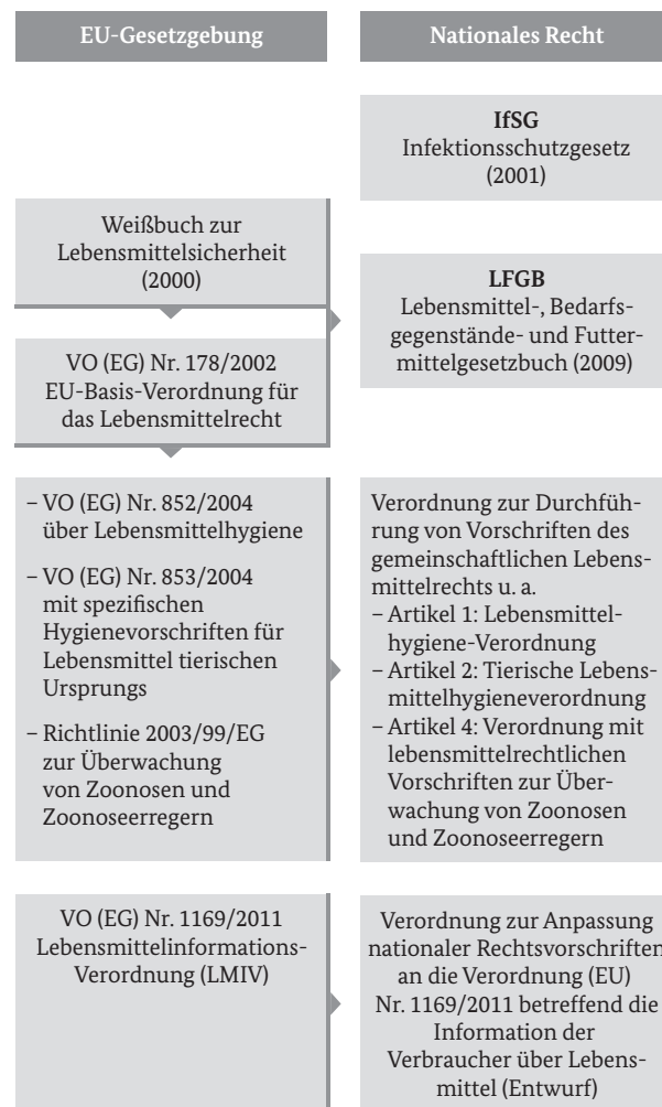
Abbildung 1: Übersicht über die rechtlichen Rahmenbedingungen in der Gemeinschaftsverpflegung

Außerdem wird die Anwendung einschlägiger DIN-Normen (zum Beispiel 10508 Temperaturen für Lebensmittel, 10526 Rückstellproben in der GV, 10524 Arbeitskleidung, 10514 Hygieneschulung) empfohlen. 42